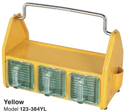
Yellow Model 123-384YL 4 997337 097505

◎ガラス容器は食品を入れることができますが、密閉性がない容器のため個包装されたものを推奨します。