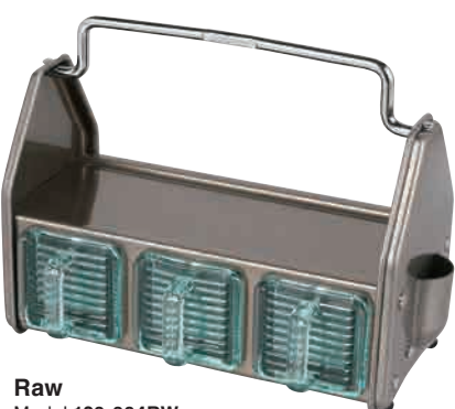
Raw Model 123-384RW 4 997337 093095