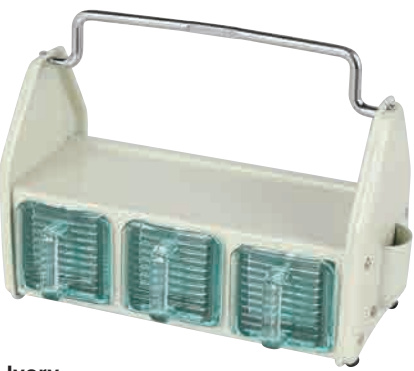
Ivory Model 123-384IV 4 997337 093088