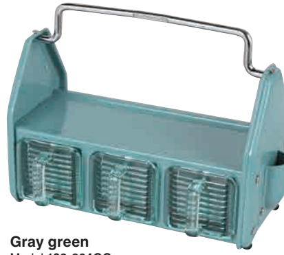
Gray green Model 123-384GG 4 997337 093071